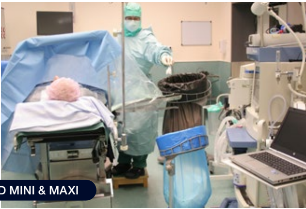
STAND MINI & MAXI