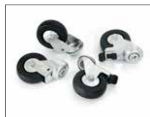
Rollensatz für Longopac Stand Dynamic Item no. 34616

Art.nr. 31480 Reduziert den Verbrauch von Sackmaterial sowie die Sackgröße. In erster Linie für klebrige und schwere Abfälle vorgesehen. Vorzugsweise für Bio-Sackmagazine nutzbar.