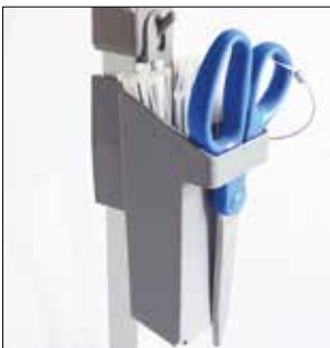
Kabelbinderhalter für Longopac Stand Classic Standard, grau. Art.nr. 30410 Metalldetektierbar, blau. Art.nr. 30416

Die Umrandung fixiert den Sack in seiner Position.