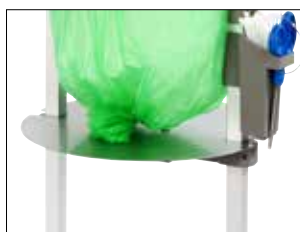
Verstellbare Platte für Longopac Stand Classic Mini

Art.nr. 34609 Satz mit metalldetektierbarer Schere, Scherenhalter und Edelstahlbraht.