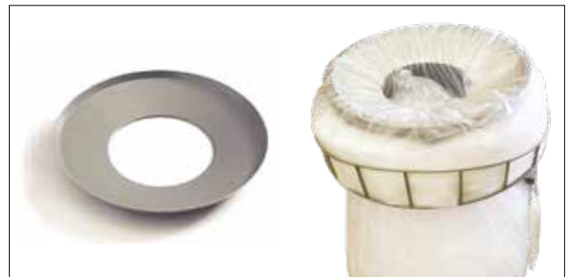
Lochscheibe für Longopac Stand Classic Maxi Art.nr. 30170

Kabelbinderhalter für Dynamic-Serie. Passend für Mini, Midi und Maxi Dynamic.