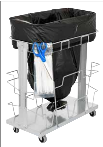
Stand Dynamic UBS