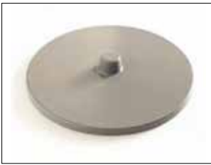
Deckel für Longopac Stand Classic Maxi und Mini