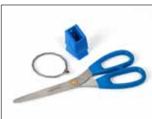
Scherensatz für Longopac Stand Dynamic, metall-detektierbar

Verkleinert die Einwurföffnung und ermöglicht eine einfachere Komprimierung z.B. von Recyclingkunststoff. Nur für Maxi lieferbar.