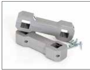
Ständeranschluss für Longopac Stand Classic Art.nr. 33750

Zum einfachen und stabilen Verbinden mehrerer Longopac Stand-Einheiten. Auch Maxi und Mini lassen sich zusammenfügen.