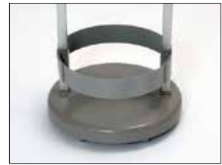
Umrandung für Longopac Stand Classic Mini Art.nr. 33890

Die Umrandung fixiert den Sack in seiner Position.