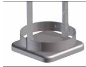
Umrandung für Longopac Stand Classic Maxi Art.nr. 33900

Zum einfachen und stabilen Verbinden mehrerer Longopac Stand-Einheiten. Auch Maxi und Mini lassen sich zusammenfügen.