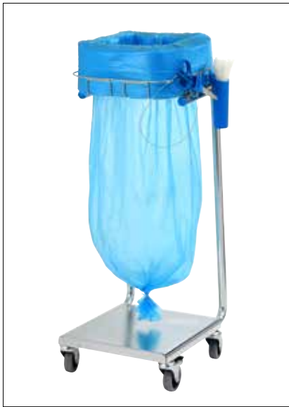
Stand Dynamic Mini/Mini Pedal