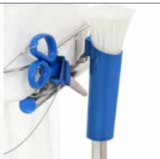
Kabelbinderhalter für Longopac Stand Dynamic Art.nr. 30410 (nur Halter)

Der Kabelbinderhalter beschleunigt Sackwechsel und hält die Kabelbinder an ihrem Platz. Passend zu Maxi und Mini, in zwei Ausführungen lieferbar.