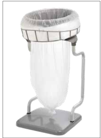
Stand Classic Recycling